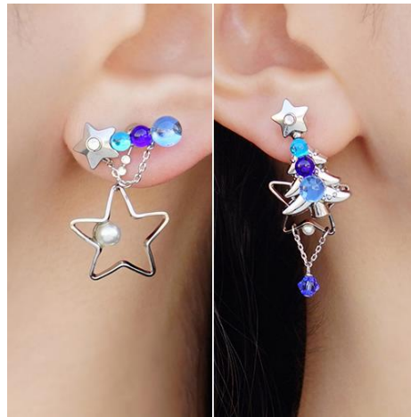
商品名：「アイス・ツリー」