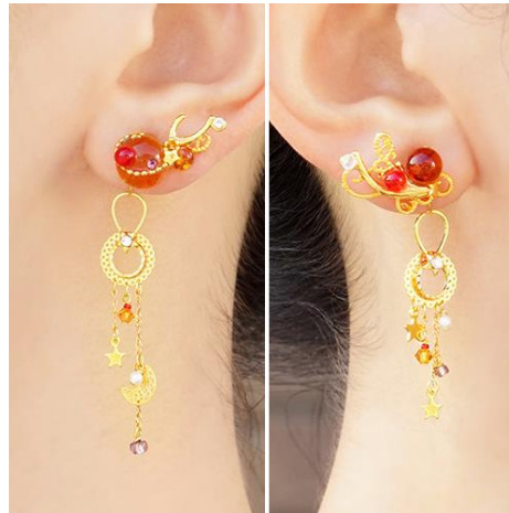
商品名：「夢見るトナカイ」