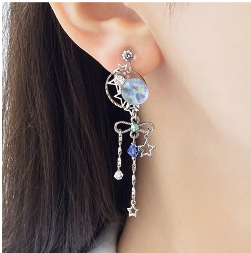
彦星～天恋～ぴあり着用写真