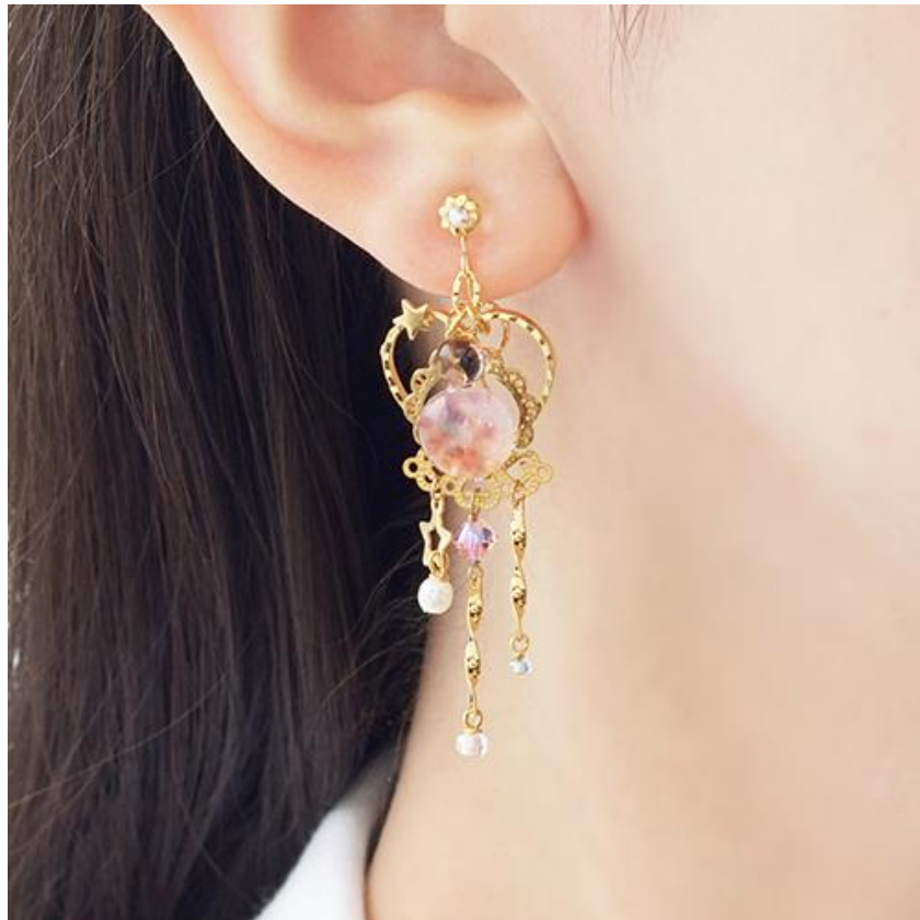
織姫～天恋～びあり着用写真