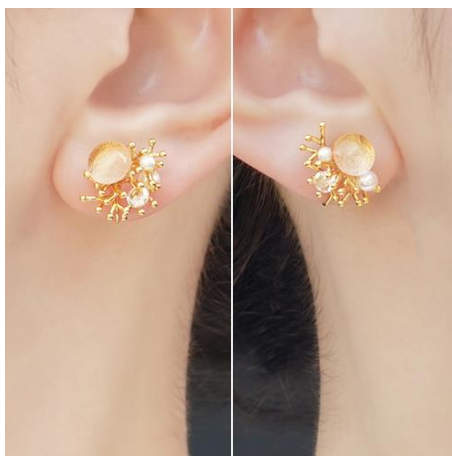
商品名：まゆら [アシンメトリー]

販売価格：ぴあり 8,250 円 (税込) / ピアス 5,500 円 (税込)