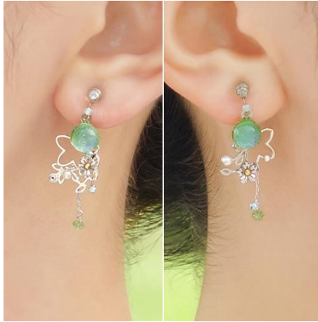
商品名：ゆり葉 [アシンメトリー] [2WAY]

販売価格：ぴあり 9,350 円 (税込) / ピアス 7,150 円 (税込)