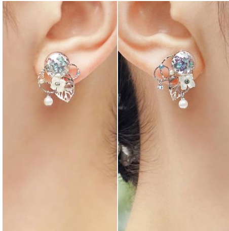
商品名：あじさい [アシンメトリー]

販売価格：ぴあり 9,350 円 (税込) / ピアス 7,150 円 (税込)