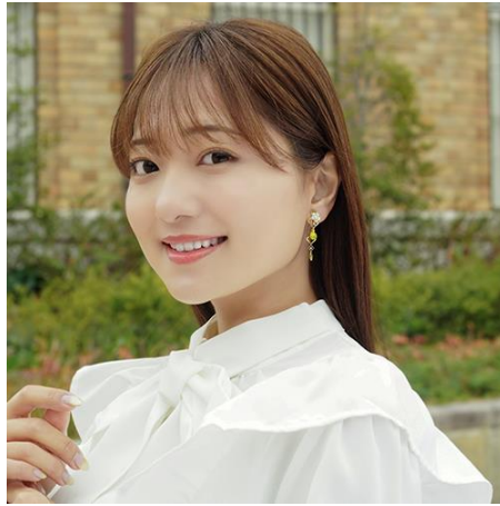
商品名：「蘭の香」(いぐさのかおり)

販売価格：ぴあり 9,900 円 (税込) / ピアス 7,700 円 (税込)