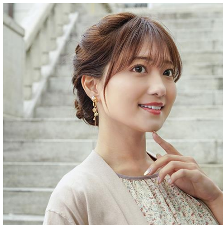
商品名：「桜恋」(はなこい)

販売価格：ぴあり 13,200 円 (税込) / ピアス 11,000 円 (税込)