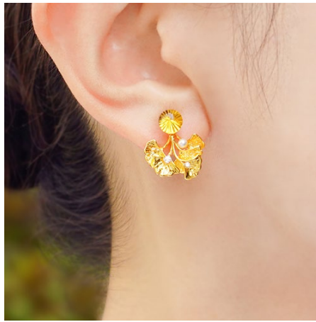
商品名：八重の黄色