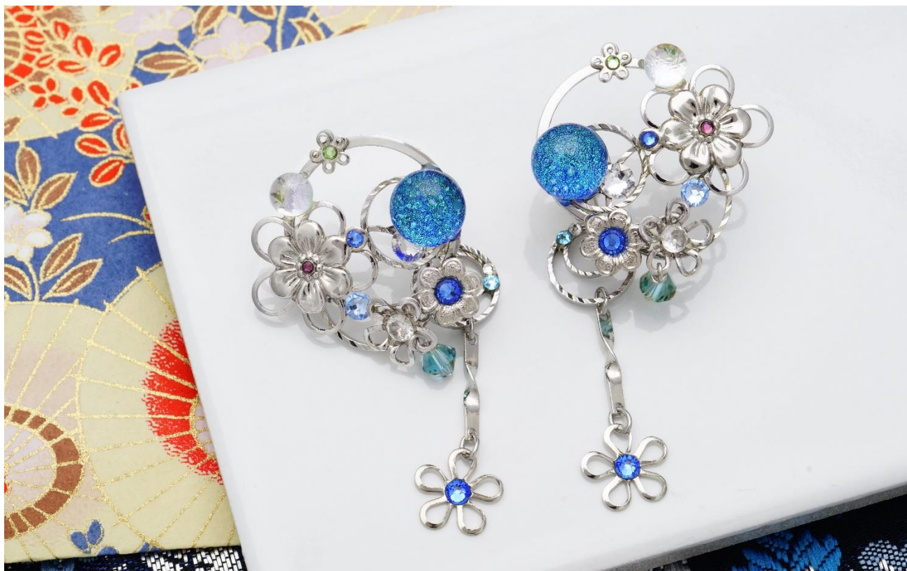
源氏物語～葵の上～びあり (1)