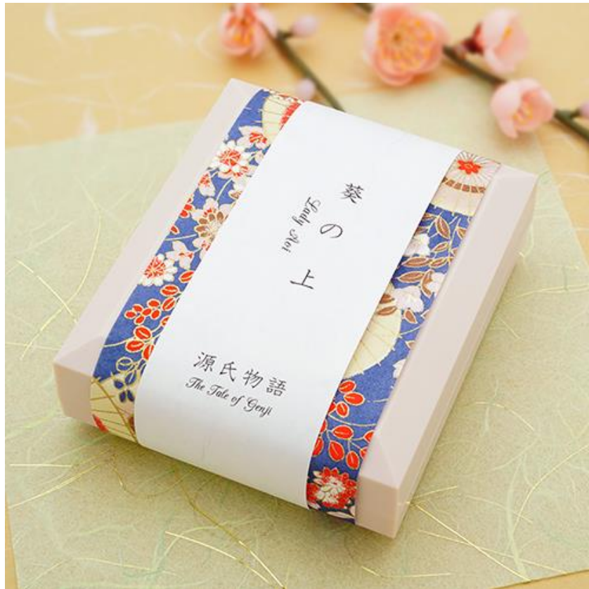
源氏物語～葵の上～びあり パッケージ