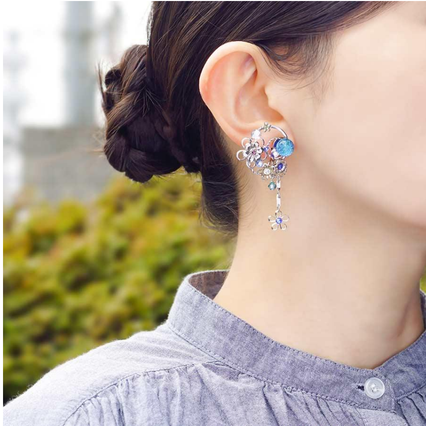
源氏物語～葵の上～びあり着用写真