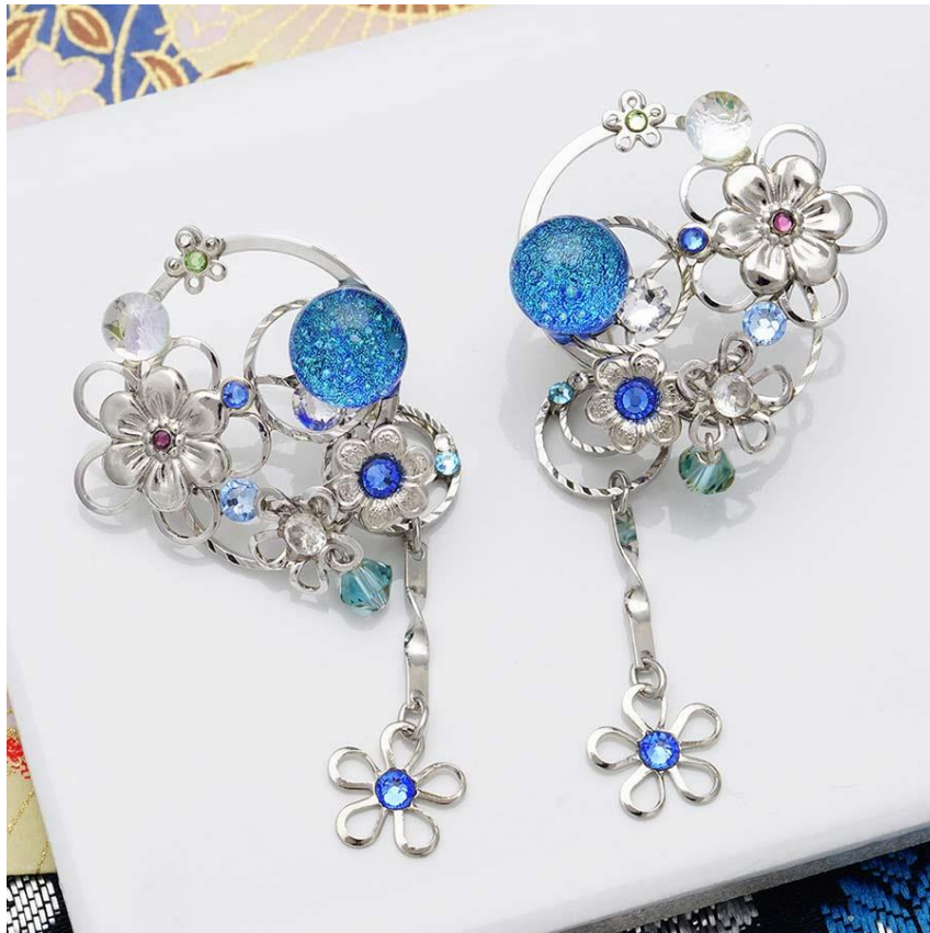
源氏物語～葵の上～びあり (2)