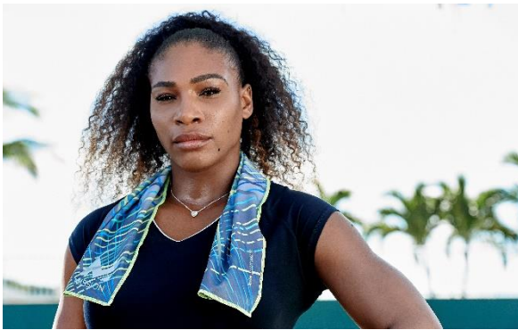
セリーナ・ウィリアムス<テニス>

独自技術「HYDRO ACTIVE」の冷却技術で、 タオルが肌温度よりマイナス 15 度になり、 身体を冷却しパフォーマンスの向上を促進。 超軽量で通気性のある生地。柔らかくドライな肌触り。 ケミカルフリー（化学成分無配合）/ UPF50+ 洗濯してもその機能は失われません。 販売価格 2,100 円（税抜）