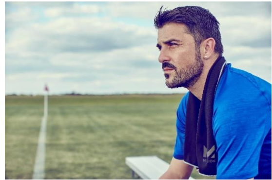
ダビド・ビジャ<サッカー>