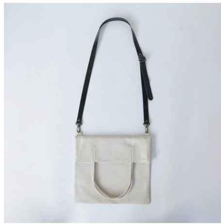
2ウェイトート「Swingy」新色 Ivory