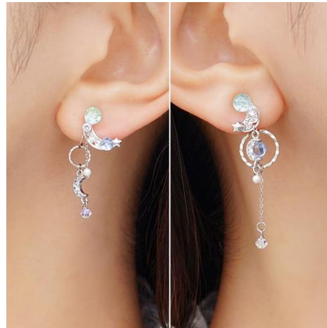
商品名：月雨の夜 [2WAY] [アシンメトリー]

販売価格：ぴあり 8,800 円 (税込) / ピアス 6,600 円 (税込)