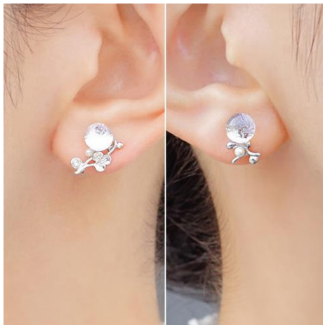
商品名：銀露 [アシンメトリー]

販売価格：ぴあり 6,600 円 (税込) / ピアス 4,400 円 (税込)