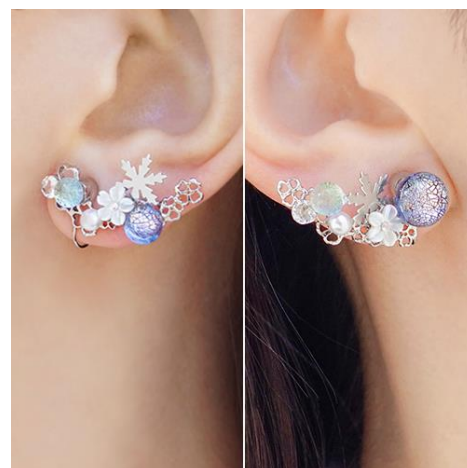
商品名：花と雪のエチュード [アシンメトリー]